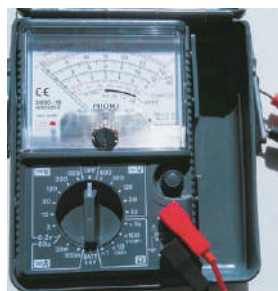
図2 固定抵抗器と抵抗値の表示